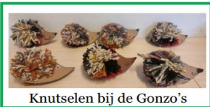
Knutselen bij de Gonzo's